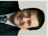
Jordi Heras Alcalde de Barcelona

Una de las prioridades del Ayuntamiento de Barcelona es mejorar los aspectos que afectan el día a día de los ciudadanos y ciudadanas. Y el transporte público es uno de los fundamentales. Es por eso que me complace presentaros los cambios que hemos hecho en el recorrido de la línea 44, que mejorará la conexión entre Barcelona y Badalona. Son intervenciones hechas en favor de la ciudadanía, para que desplazarse entre estos municipios sea cada vez más cómodo y fácil.