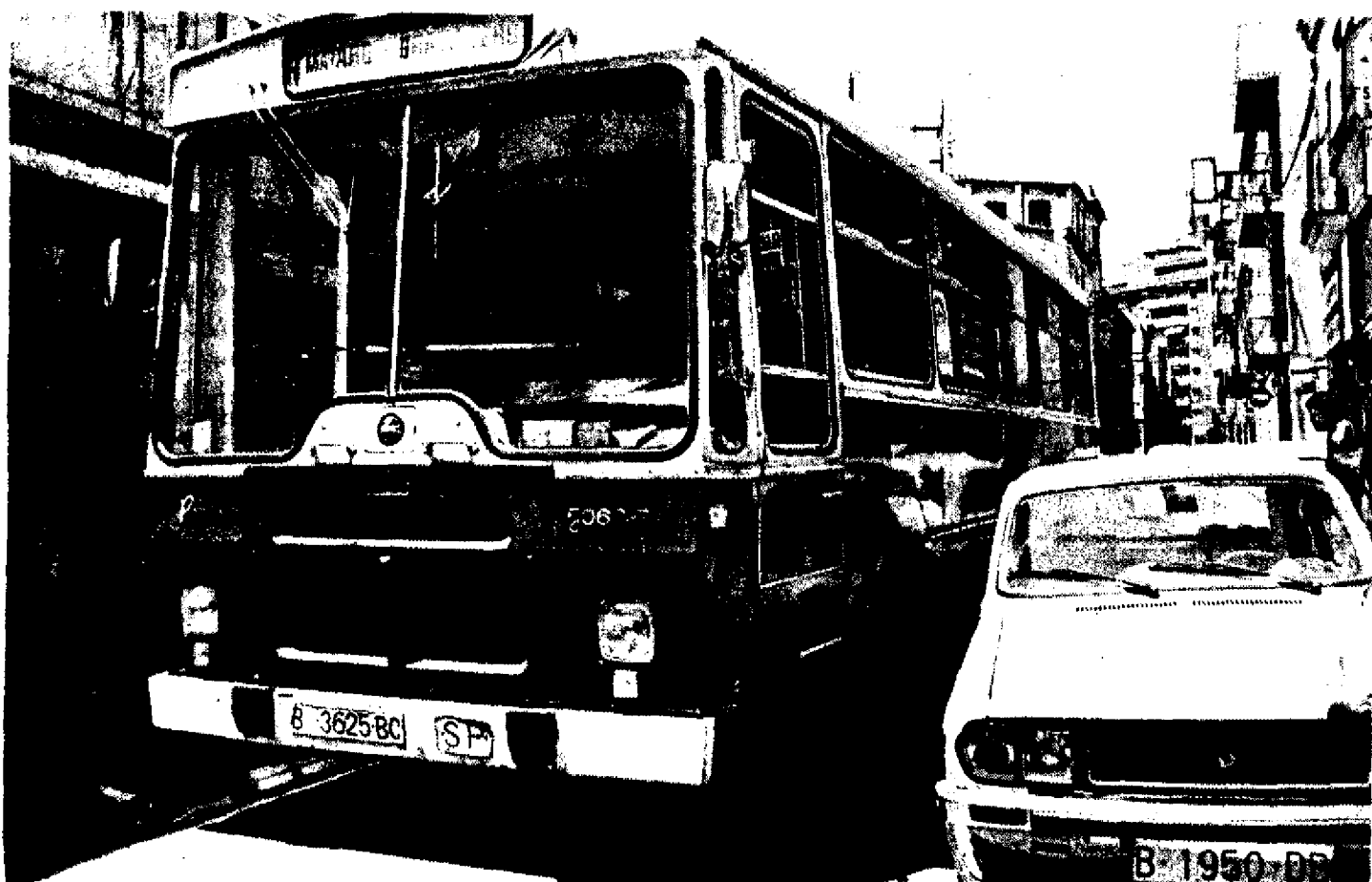
A punt de fer tap.

Anar amb autobús, si no arribes a l'hora a la parada o no n'ets client habitual, d'aquells que cada dia agafen el mateix autobús a la mateixa hora, per anar allà mateix, no val pas la pena. Si t'has d'estar mitja hora per anar del Parc a l'Estació o tres quarts per baixar de Rocafonda a la Plaça de Santa Anna, més val fer el camí a peu o aturar un taxi, si tanta pressa hi ha.