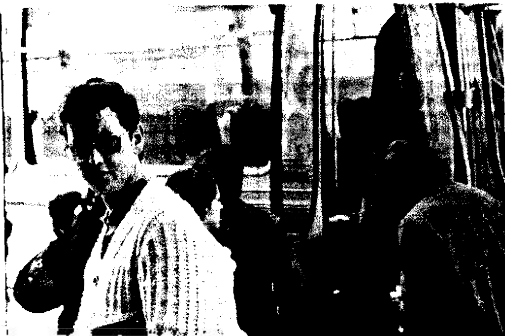
Quel poble ho decideixi

No ens han sabut dir el promig diari de recaptació perquè, ens comuniquen, "la recaptació d'un conductor durant la seva jornada laboral depèn dels dies i dels serveis". Endevinem, però, que la seva bossa serà bastant més inflada que la de l'altra companyia perquè els seus