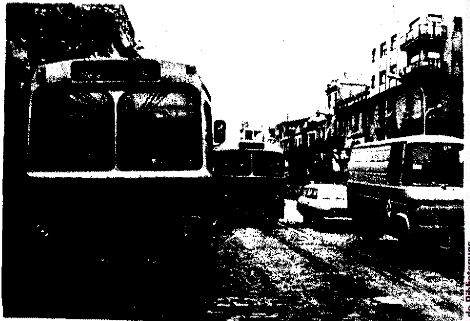
El tallant puja Rambla amunt

Cerdanyola, Peramàs, Pla d'en Boet i La Llàntia, a una banda; Vista Alegre, Rocafonda, El Palau, l'Escorxador, Sant Simó i l'Havana, a l'altra. Només Cirera, que està aixarrancada enmig mateix del full del ganivet, té comunicació amb tots dos trossos de ciutat. Això sí, el planificador ha tingut cura de no barrejar la roba i el barri cometa amb un autobús diferent per a cada banda.